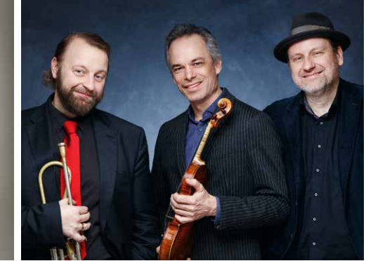
Breinschmid & Gansch Tiro