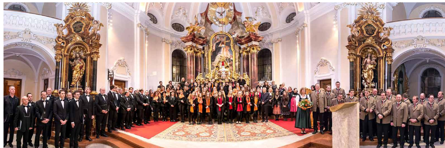
AGACH Chorweihnacht 2016

AUTOR Erich Deltedesco, Präsident der AGACH