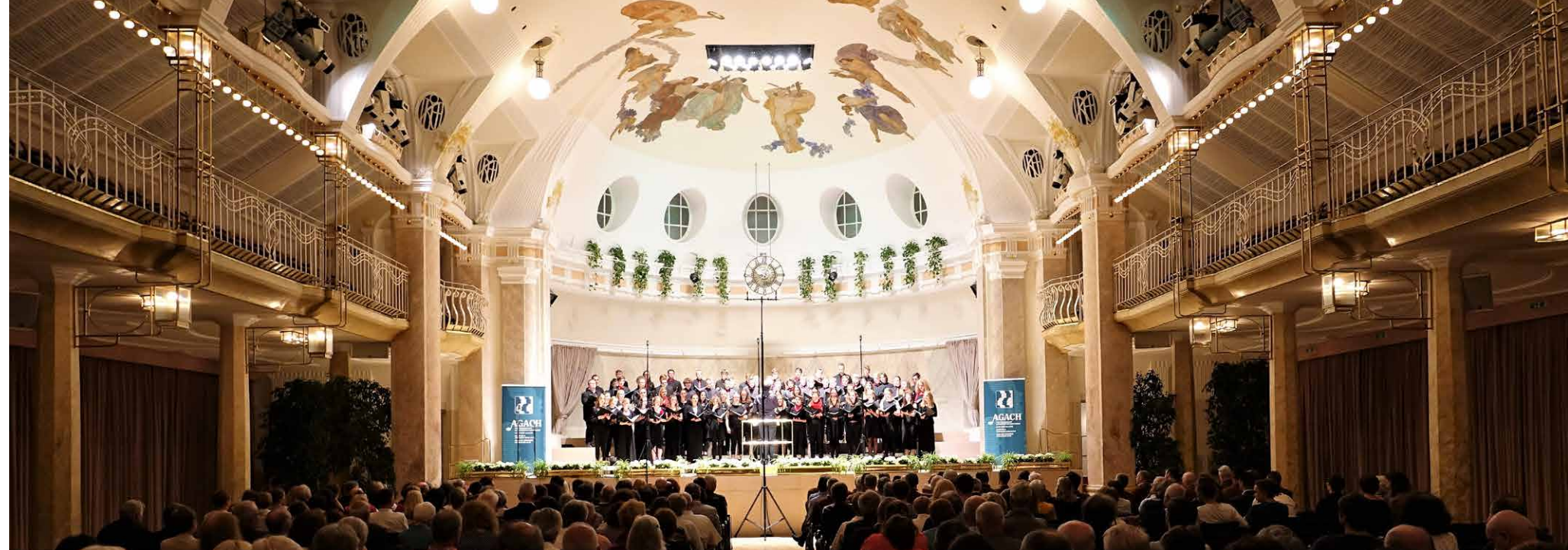
AGACH 40 Jahr Jubiläum